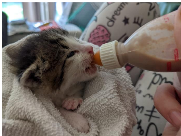
Kotě krmené z flašky