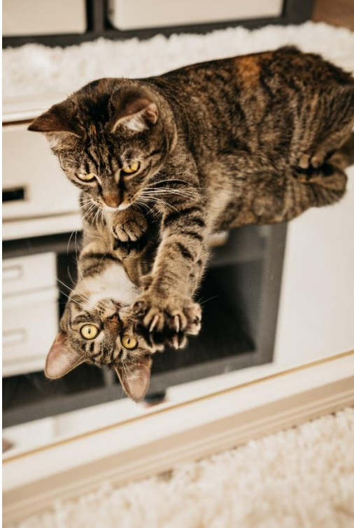
Ukázka z benefičního kočičího kalendáře

Dne 1.12.2022 jsme podepsali smlouvu o příjmu koček a kastračním programu s městem Česká Lípa. Kočky vozí městská policie do depozita Volfartice s tím, že po několika dnech, kdy se může přihlásit původní majitel, se kočky budou přesouvat do karantény v Chrastavě.