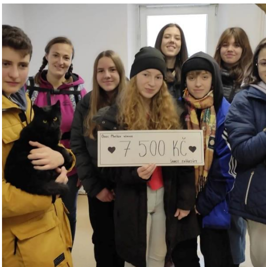
Devátáci z MŠ Mníšek 1

S naším benefičním stánkem jsme navštívili putovní Tatrhy a jako vždy Vánoční adventní trhy v Liberci.