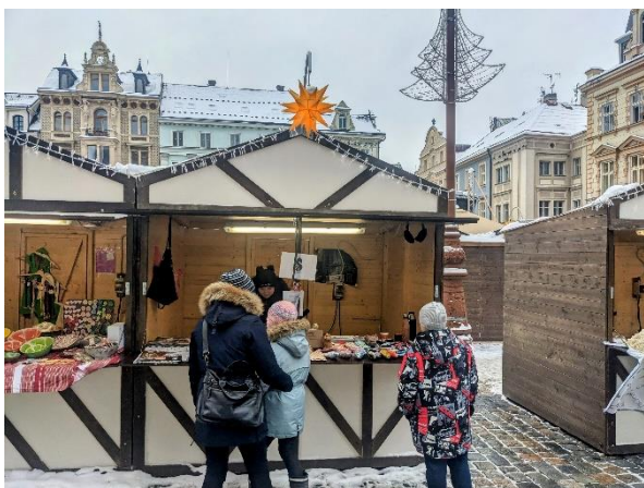
Stánek na adventních trzích v Liberci

Firma Arceco, s. r. o. nám věnovala 20 000 Kč.