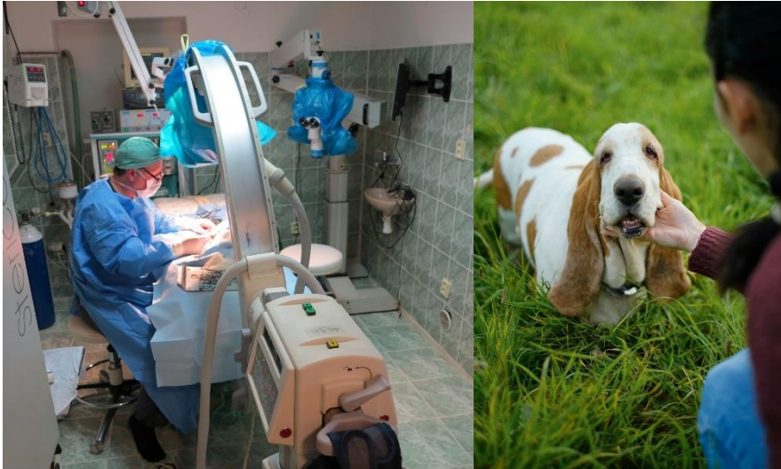
Operace zlomené nohy kocouka Kvída